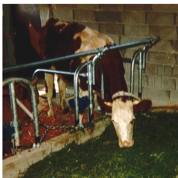
Attache BERA-FIX sans séparations de crèche