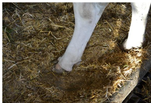
Le tapis paillé permet aux animaux de se lever en toute sécurité