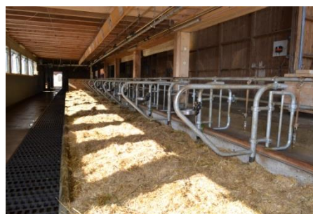
Les longues arceaux de séparation sont parfaitement conformes aux besoins des animaux