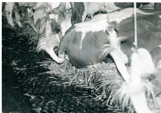
Système de garde conforme aux besoins des animaux, sur paille non hachée, Grâce au seuil qui retient la paille, il s'avère même possible de combiner ce système de COUCHES-PAILLÉE avec un système d'évacuation par voie liquide.