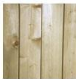
PIN DU NORD